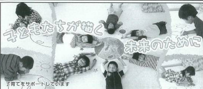
子育てをサポートしています

SHOEI PRINTING 昭栄印刷株式会社 ●本社・工場 〒959-2415 新潟県新発田市住田97 TEL 0254-39-0000 (代) FAX 0254-39-6003 ●東京営業部 〒108-0073 東京都港区三田1-1-15-4F TEL 03-5418-7667 (代) FAX 03-5418-7668 ●営業所 大阪営業所 ISO9001/ISO14001は本社・工場にて認証取得