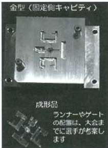
プラスチック金型競技課題例

当校の学生は、多くの技術・技能を身につけるべく日々励んでいます。当校の学生と同世代の技能五輪選手を見て、私もこのような技術者を育てていきたいという気持ちがいよいよ強くなりました。今後とも新潟職能短大をよろしくお願ひいたします。