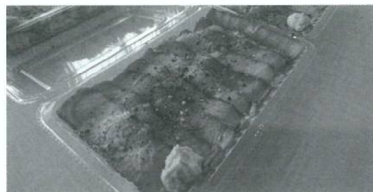
元祖ローストビーフ弁当

祖ローストビーフ弁当(税込500円)が人気のお弁当です。しつかり肉の処理を行い、こだわりの焼き方で調理しております。お肉が苦手な方にもこれなら食べられると評判の声を頂いております。タレは何年も継ぎ足しの秘伝のタレを使用、お米は昆布と一緒に炊いており、旨味の効果をひきだしています。自分なりに一つのお弁当にこだわりを注いでおります。そして、その他に日替わりで様々なお弁当をしています。インスタグラムの方に詳細を掲載させて頂いておりますので良かったら拝見して見てく