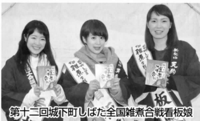
第十二回城下町しばた全国雑煮合戦看板娘