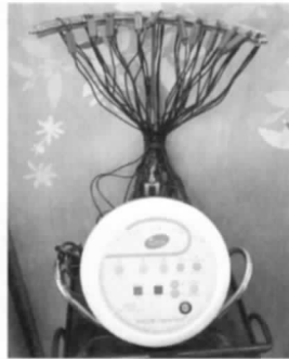
新たに導入したデジタルパーマ機

①新発田市新富町2-4-11 ②8:30~18:30 ③毎週月曜日・第1火曜日・第3日曜日 ④0120-246375 ⑤8台 ※スタッフ募集中!詳しくは当店まで