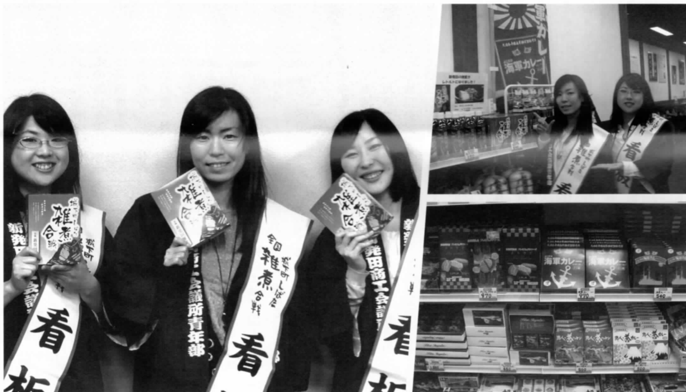
PRする商工会議所青年部城下町しばた全国雑煮合戦の看板娘