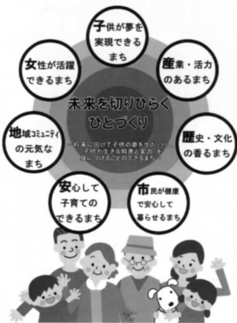
「目指すべき7つの都市像」

心して出産し、保護者などが安心して子育てのできるまちをめざす。そのためには、保護者の子育てにおける負担を軽減するための施策を実施するとともに、働く女性が仕事と子育てを両立できるような制度の充実を図る。 ◆育児サポートとして、延長保育・病児保育・放課後児童クラブの充実をはかる。併せて育児コンシェルジュの設置・育児サークルの活性化についても検討する。 ◆企業内保育を実施する企業に対する支援制度を創設する。 ◆保育園の保育料の無料化、高校までの医療費の無料化により、子育て世帯の経済的負担を軽減する。(以下、次号に続く)