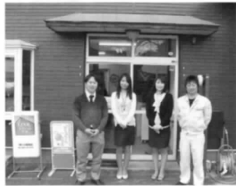
「会社が家庭で社員は家族!」

ワーク・ライフ・バランスへの取組(各種休暇制度、時間外勤務の削減)、育児や介護と仕事との両立支援、ライフスタイルに合わせた多様な雇用形態、女性のキャリアアップ支援、性別にとらわれない人材の活用・登用等の詳細が特集されています。 株大堀商会では、ワーク・ライフ・バランスを実現するための社内プロジェクト「スマイルプロジェクト」を立ち上げ、会社が「社員がやりがいを持って働き、家庭や地域社会でも多様な生き方・実現できる会社を目指すこと」を目的として掲げ、社員と意識を共有することからスタート、各部署から選任された「ワーク・ライフ・バランス推進委員